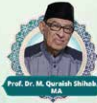
Prof. Dr. M. Quraish Shihab, MA